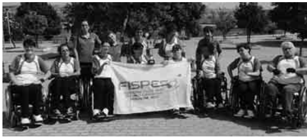
LA SQUADRA FEMMINILE DELL'HANDY SPORT RAGUSA CHE SARÀ IMPEGNATA NELLE GARE TRICOLORI DI RIETI