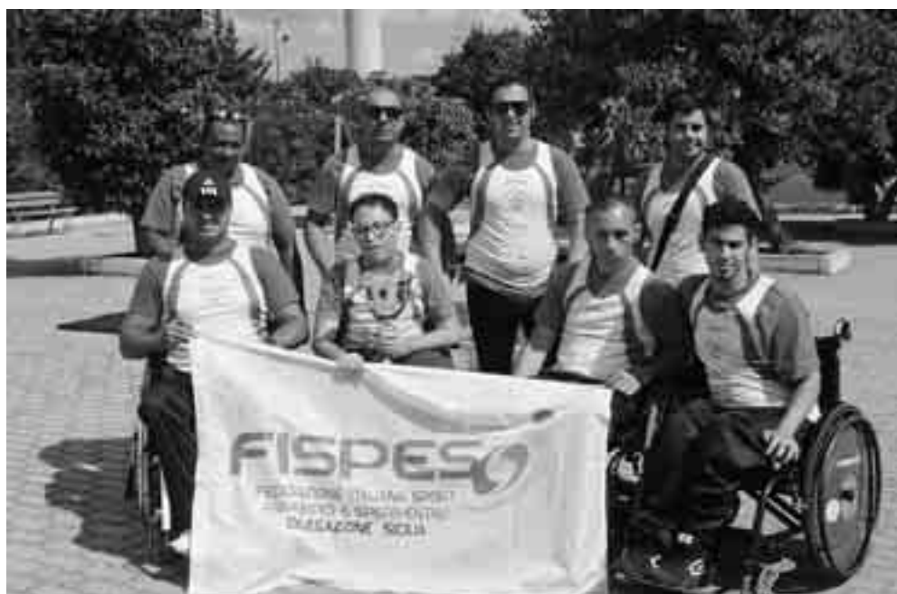
LA SQUADRA DELL'HANDY SPORT RAGUSA MASCHILE CHE SARÀ IMPEGNATA NELLE GARE TRICOLORI DI RIETI