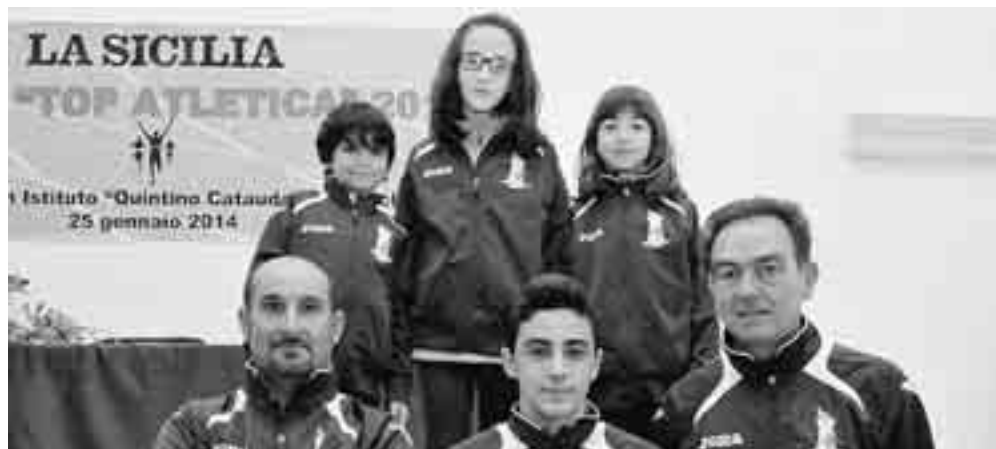
UN GRUPPO DI ATLETI DELLA LIBERTAS ACATE, LA SOCIETÀ PROTAGONISTA IERI NEL GP GIOVANILE DI RAGUSA